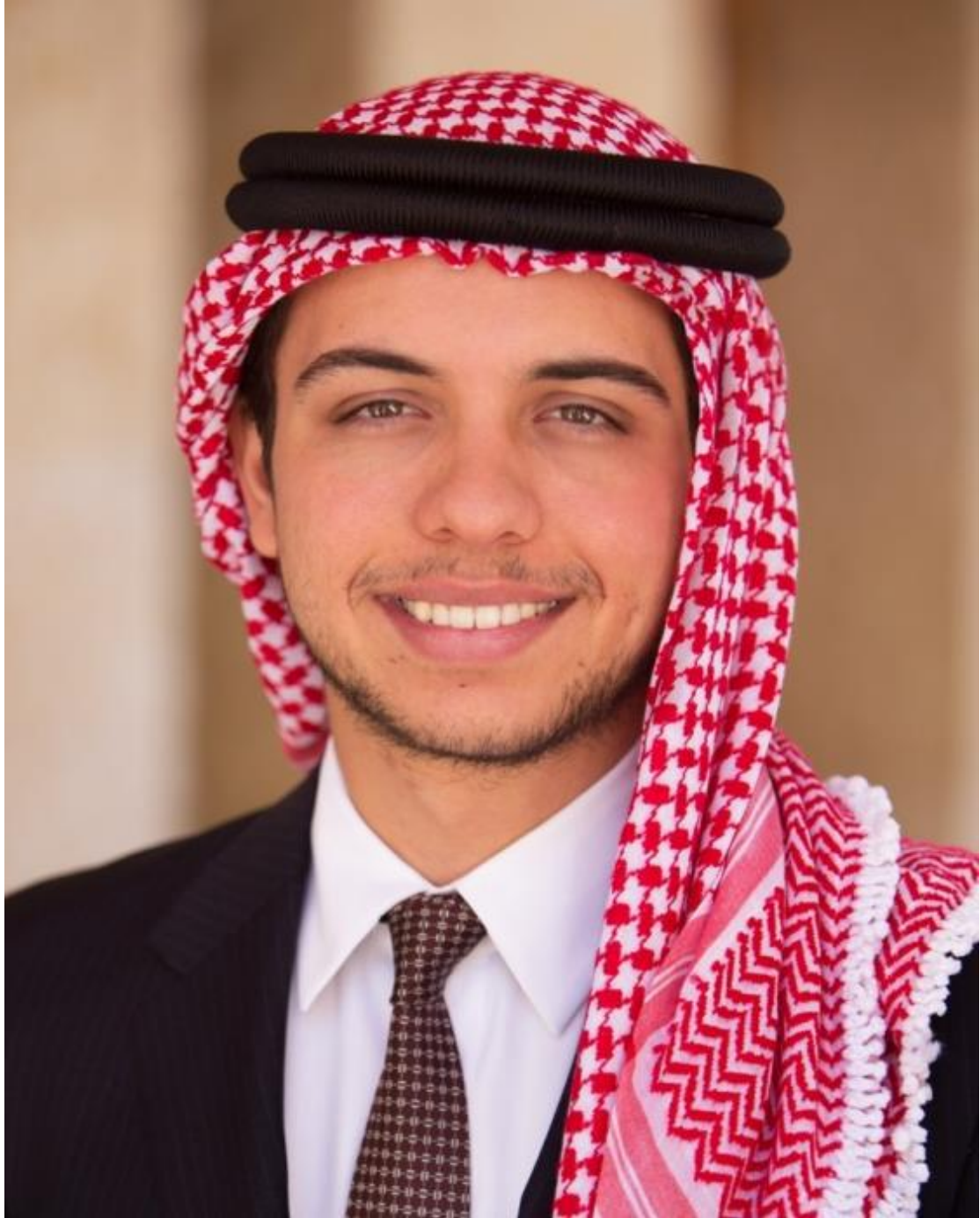
صاحب السمو الملكي الأمير الحسين بن عبد الله الثاني