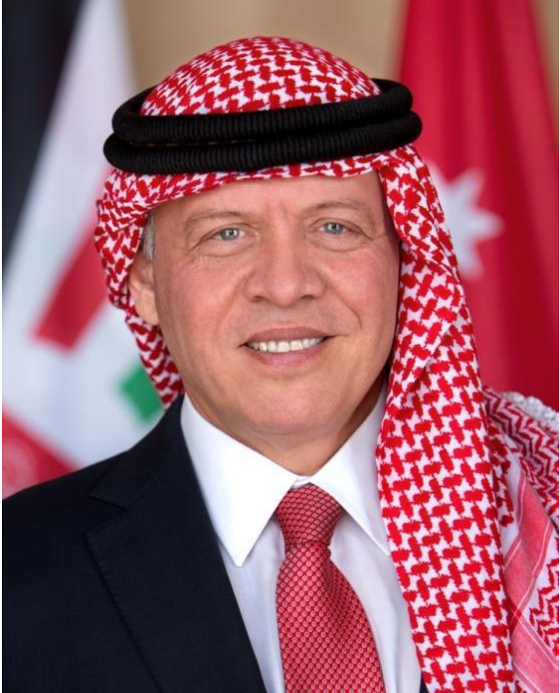
صاحب الجلالة الماشمية الملك محمد الله بن الحسين المعظم